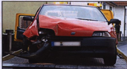
Tatort Assenheimer Strasse: Wieder einmal viel zu schnell !

Dorn-Assenheim, 1. Oktober 2008. Der CDU Stadtverbandsvorsitzende Holger Hachenburger hatte sich mit der Leiterin der Kindertagesstätte in der Assenheimer Strasse Richtung Ortsausgang Süd getroffen. Geplant war ein Pressefoto und eine Geschenkübergabe, da die Kita in Kooperation mit der CDU die kürzlich aufgestellten Tempo 30 Figuren angefertigt hatte. Acht Kinder waren dabei – und kurz vorher rauschte ein PKW aus Richtung Ortseingang kommend frontal gegen die Hauswand in der Kurve. Es ist nicht der erste Vorfall dieser Art.